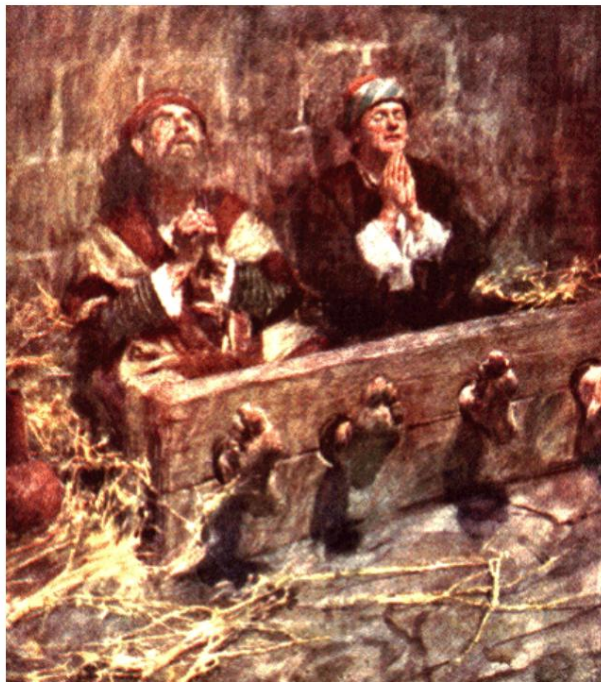
Paulus und Silas im Gefängnis preisen den HERRN.

Als Christen müssen wir uns sehr genau ansehen, was das Wort Gottes über die Zeit sagt, in der wir leben. Insbesondere müssen wir darüber nachdenken, was uns die Bibel über von der Regierung auferlegte Maßnahmen sagt, die auf einen „Lockdown“ hinauslaufen.