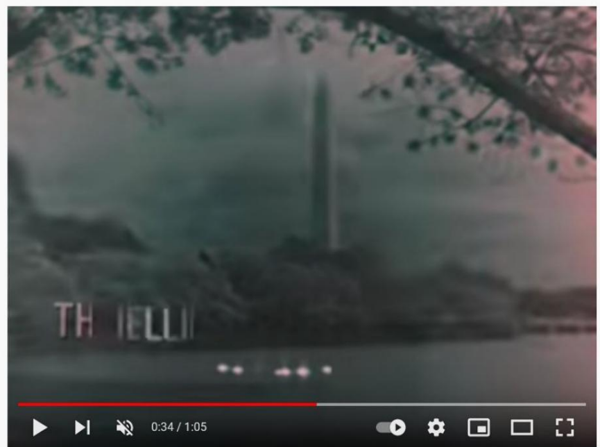
National Anthem (1960s TV Station Sign-Off)