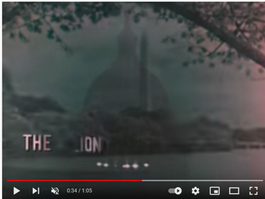
National Anthem (1960s TV Station Sign-Off)