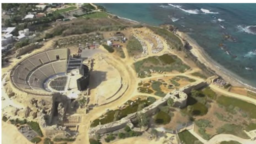
Caesarea Maritima, wo König Herodes Agrippa von Gott gerichtet wurde.

„Und an einem bestimmten Tag setzte sich Herodes, in königliche Gewänder gekleidet, auf seinen Thron und hielt eine Rede vor ihnen. Und das Volk schrie und sprach: Es ist die Stimme eines Gottes und nicht eines Menschen.“ (Apostelgeschichte 12:21-22)