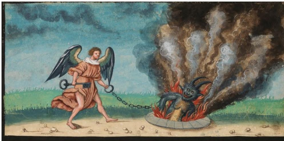
Ein Engel fesselt den Drachen, Augsburgische Schule um 1550

Außerdem liegt zu diesem Zeitpunkt auch sein dämonischer Meister in Ketten, da er für tausend Jahre in den Abyss geschickt wurde!