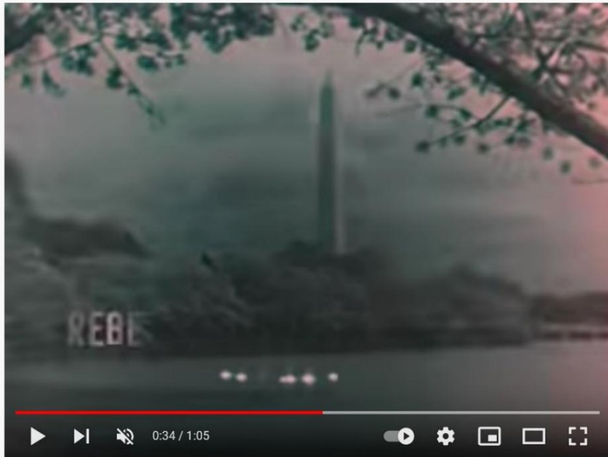
National Anthem (1960s TV Station Sign-Off)

https://www.youtube.com/watch?v=QMZ_rQKAy7c