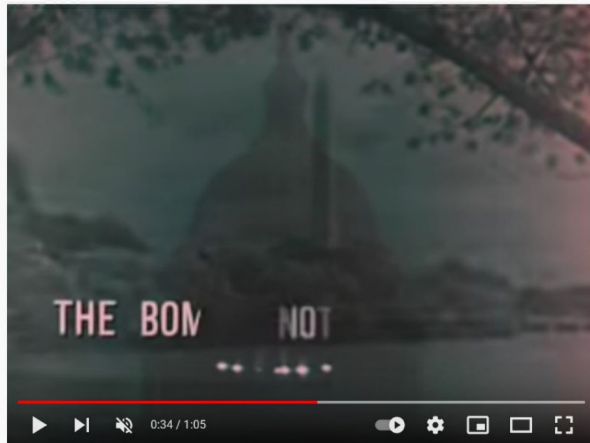
National Anthem (1960s TV Station Sign-Off)