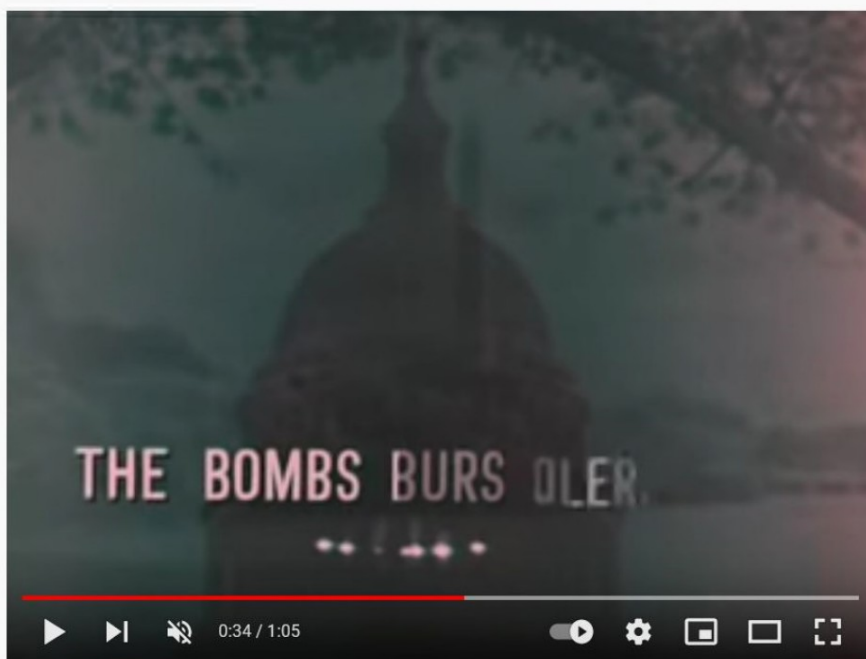
National Anthem (1960s TV Station Sign-Off)