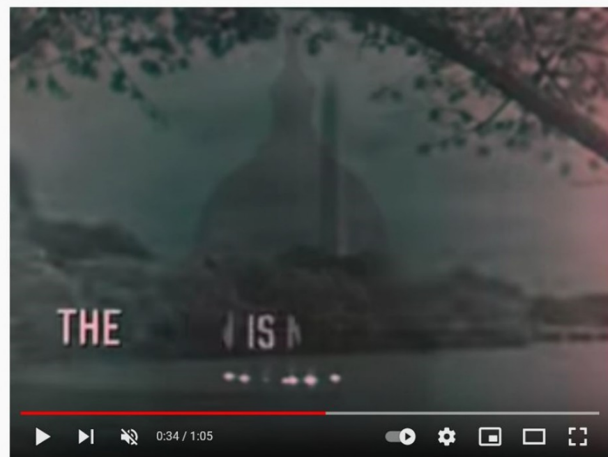
National Anthem (1960s TV Station Sign-Off)