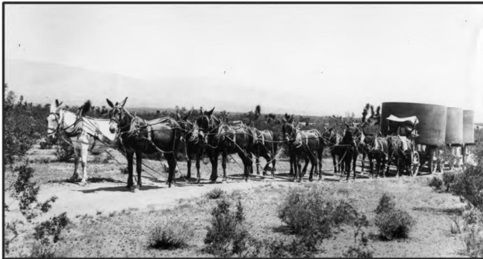
Maultierzug, der 1903 Wassertanks in Kalifornien transportierte.

Interessanterweise ist das Maultier selbst oft langlebiger als seine Mutter und intelligenter als sein Vater. Außerdem ist er ein effizientes Zugtier und wurde vor dem Aufkommen des Verbrennungsmotors zum Beispiel von Bergleuten viel genutzt.