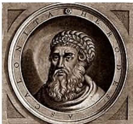
Herodes der Große

Unsere Pastoren und Prediger sollten vor dem Sauerteig des Herodes warnen, aber das tun sie nicht!