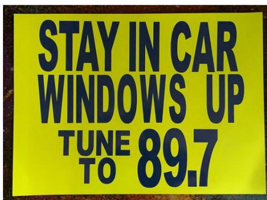
Hinweis auf der Facebook-Seite der Temple Baptist Church.