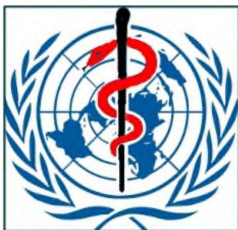
Logo der Weltgesundheitsorganisation [mit zusätzlicher Farbe zur Hervorhebung]

Wann werden die Satanisten mit ihren Lügen aufhören? Niemals. Ihre Lügen werden nur noch schlimmer – unverschämter, blasphemischer, giftiger. Wenn wir uns nicht täglich in Gottes Wort vertiefen und um Urteilsvermögen beten, werden wir auf einige dieser Lügen hereinfallen. Wir werden vergessen, dass wir einen Feind haben und dass seine Legion von Anhängern unter seiner Führung niemals aufhören wird, bis sie die Erde erobert haben.