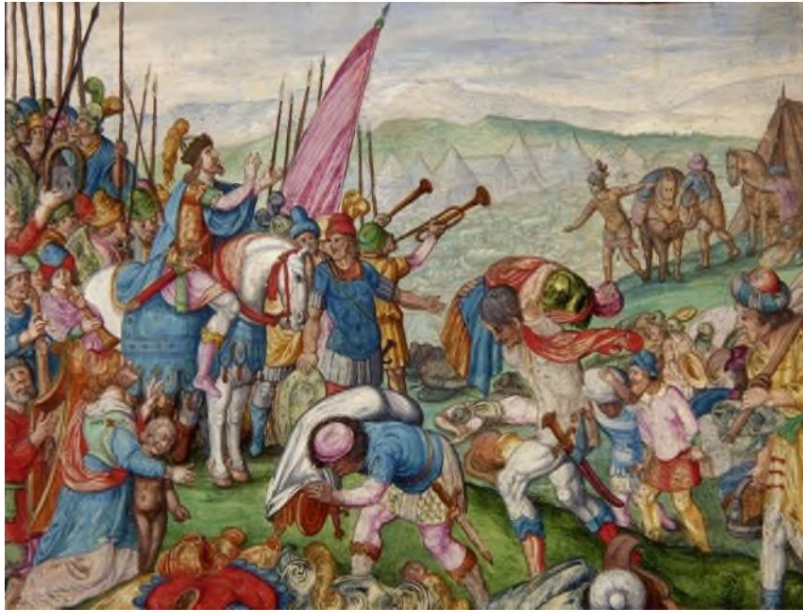
Der HERR vernichtete die heidnischen Heere in der Wüste von Tekoa.

Die Amerikaner glauben seit langem, dass die Sicherheit ihrer Nation in nicht geringem Maße von der zweiten Änderung abhängt, nämlich von ihrem Recht, Waffen zu behalten und zu tragen. Zweifellos hat sich dies als sinnvolle Maßnahme erwiesen und bisherige Versuche zur Destabilisierung ihres Landes behindert. Die Notwendigkeit, den Zweiten Verfassungszusatz zu verteidigen und beizubehalten, mag jedoch viele Amerikaner für ihre einzig wahre Quelle des Schutzes blind gemacht haben – ihr Vertrauen in den HERRN, den Gott Abrahams, Isaaks und Jakobs, und ihre persönliche Beziehung zu Seinem Sohn, Jesus Christus von Nazareth.