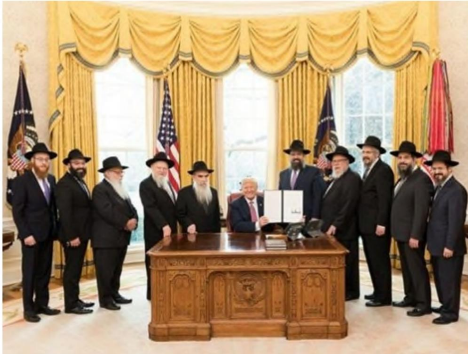
Präsident Trump mit den Chabad-Rabbinern, 28. März 2018.

Die Noahide-Gesetze sind böse antichristlich Obwohl sie einen biblischen Glanz haben, sind diese Gesetze böse antichristlich, und jeder Präsident, der sie unterstützt, ist ein Verräter. Donald Trump hat dies getan, zusammen mit jedem seiner Vorgänger bis hin zu Jimmy Carter. Bitte lesen Sie unsere Abhandlung, Der finstere Zweck der sogenannten Noahide-Gesetze (Nr. 183) für eine detaillierte Untersuchung dieses tödlichen Plans, dem amerikanischen Volk ein talmudisches Rechtsregime aufzuzwingen.